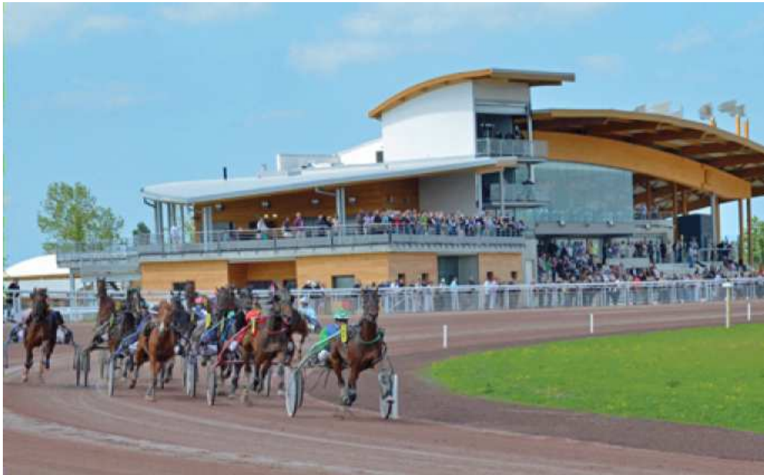
Hippodrome de Laval Bellevue la Forêt

Invitation au Chapitre Magistral d'Intronisation du 23 mars 2019